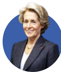
Caroline Cayeux Présidente de l'ANCT